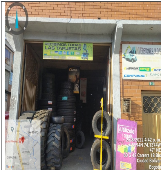
Foto 1. Vista general del establecimiento.

Posterior al requerimiento SDA. 2017EE239214 del día 27 de noviembre de 2017 generado por el incumplimiento normativo evidenciado en la primera visita realizada al establecimiento INVERSIONES JLD SAS , Por lo anterior se procede a realizar visita de seguimiento (Segunda visita) el día 25 de agosto de 2022 al establecimiento de la razón social INVERSIONES JLD SAS , con el fin de verificar el cumplimiento del requerimiento SDA. 2017EE239214 del día 27 de noviembre de 2017 , evidenciando que el establecimiento no ha cumplido con lo solicitado en el requerimiento mencionado en el presente párrafo CON RESPECTO A: no realiza el reporte mensual de las llantas almacenadas.