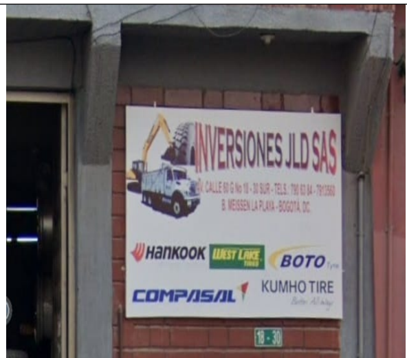
Foto 4. Vista general de la Publicidad Exterior Visual.