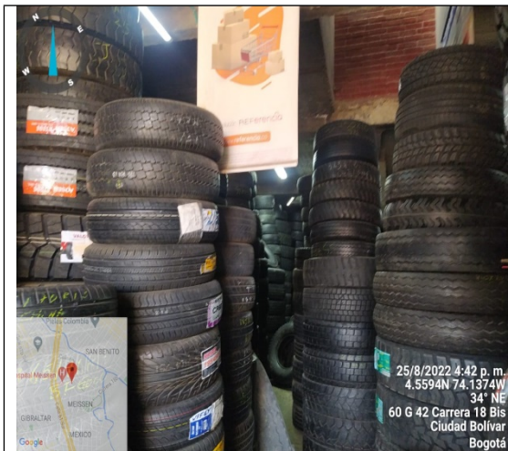
Foto 3. Vista general del acopio de llantas.