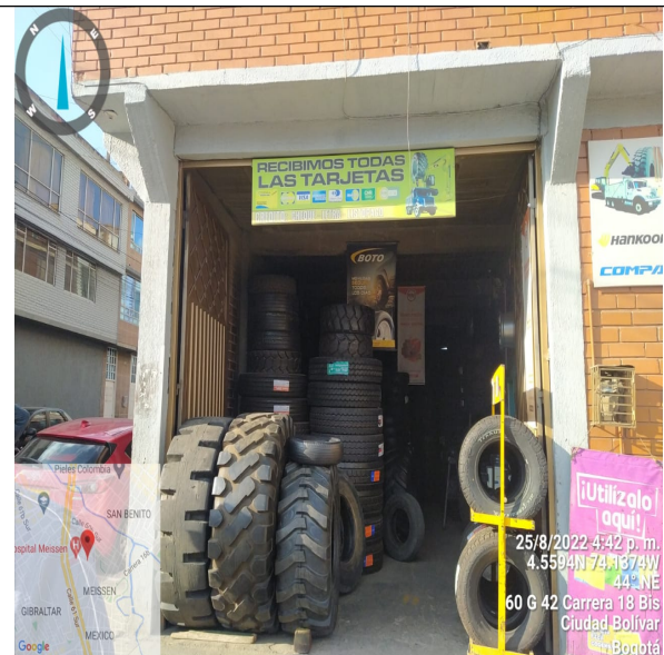
Foto 2. Vista general del acopio de llantas.